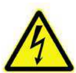
100mm magas háromszög