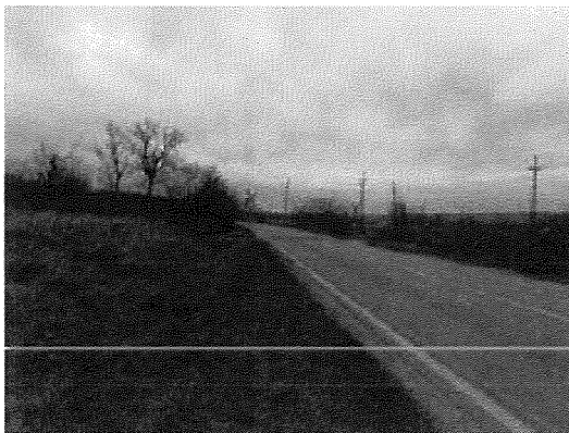
81. sz. főközl. út Mór felől benne a bontandó átjáróval 6. sz. kép

A főközlekedési út az átjáró környezetében egy R \sim 2000 \text{ m} sugarú jobbos ívben fekszik, 2 \times 1 sávos és \sim 7,00 \text{ m} széles (6 - 7. sz. képek), az átjáró környezetében a vágányburkoló elemek végéig való burkolatszél kifuttatással. A vasúti pályát 9,60 \text{ m} széles külső - belső elemes Strail burkolatú, jelzőörös biztosítású átjáróval keresztezi.