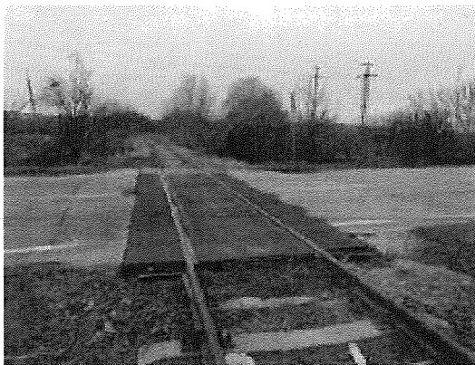
Bontandó Strail burk. vasúti átjáró Mór felé 4. sz. kép

A 9,60 m sz. vasúti átjáró külső - belső Strail elemekkel burkolt. A vasúti vágánytengely ~ 86°-kos szöveget zár be az úttengellyel. A nagy és nehéz gépjármű forgalom következtében a külső elemek mellett a burkolat repedezett, rések keletkeztek (4 - 5. sz. képek).