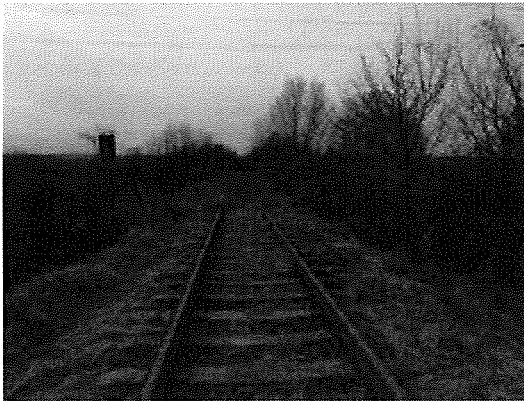
Használaton kívüli vágány Mór felé 2. sz. kép

A vontatóvágány az útjáróval érintett szakaszon egyenes, rendkívül elhanyagolt, a vasúti pályába fák lógnak be, ill. bokrok nőttek benne. (2 - 3. sz. képek). A vágányban a 24+15,20 - 24+39,20 szelvények között (útátjáróval érintett szakasz) 48 r. sínek található "LM" jelű vb. aljakon geó-s leerősítéssel ~ 50 cm vastag zúzottkő ágyzatban, egyébként pedig nagyrészt "B" jelű (szórványosan "TM" jelű vb. aljakon) nyíltlemez-es leerősítéssel ~ 40 cm vastag zúzottkő ágyzatban hevederes illesztéssel.