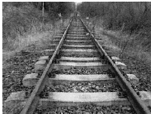
Hevederes illesztés a 24+39,20 szelvényben 9. sz. kép

A vágányzónán kívül az útpályát is fel kell bontani teljes szélességben Székesfehérvár felé az úttengelyben 3,50 m-re, Mór felé pedig 4,80 m-re visszamért távolságig. Ez a meglévő aszfaltvágástól 1,00 - 1,00 m-t jelent mindkét irányban. Szintén teljes szélességében fel kell marni az aszfalt kopóréteget Székesfehérvár felé az úttengelyben 3,90 m-re, Mór felé pedig 5,20 m-re visszamérve. Ez az úttengelyben 1,40 - 1,40 m-t jelent mindkét oldalon az útpályákba a meglévő aszfaltvágásokon kívül. A felbontott útpályában a vasúti pálya bontásából visszanyert zúzottkőből tömörített útalapot kell képezni, melynek megkívánt tömörségi foka T_{ry} = 95\% . Erre kerül a 30 cm vastag betonréteg, majd a kétrétegű aszfalt burkolat. A csatlakozásoknál a meglévő bitumenes rétegeket szélvágóval fel kell vágni, majd 20 - 20 cm-es átfedéssel kell az új bitumenes rétegeket leteríteni az újonnan épített alaptestre.