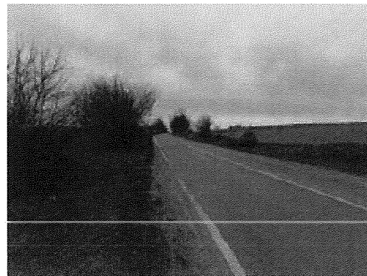
81. sz. főközl. út Mór felé 7. sz. kép