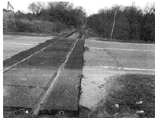
Bontandó Strail burk. vasúti átjáró Pusztavám felé 5. sz. kép