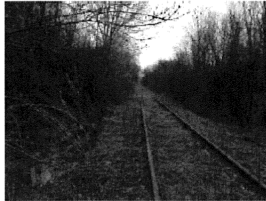
Használaton kívüli vágány Pusztavám felé 3. sz. kép

A 9,60 m sz. vasúti átjáró külső - belső Strail elemekkel burkolt. A vasúti vágánytengely ~ 86°-kos szöveget zár be az úttengellyel. A nagy és nehéz gépjármű forgalom következtében a külső elemek mellett a burkolat repedezett, rések keletkeztek (4 - 5. sz. képek).